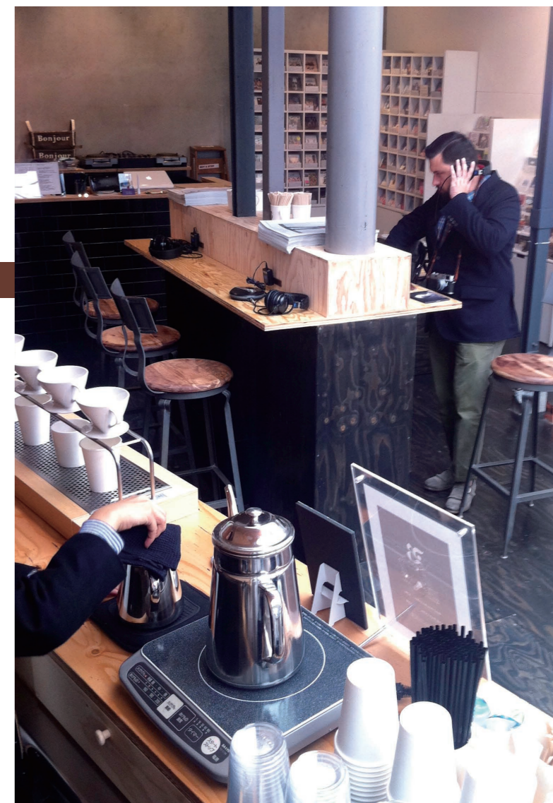
写真2 今年15周年を迎え、10月にリニューアルした「bonjoir records」が店内に設置したキオスクタイプのコーヒーショップ「bonjoir Brown Water」

店名は「bonjoir Brown Water (ボンジュール ブラウンウォーター)」。店内の中央部にはスツールが数席設けられ、CDの試聴や本などをゆっくり選ぶことができるようになった。