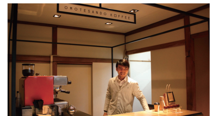
写真1 当初2013年2月までの期間限定の営業を予定していた「OMOTESANDO COFFEE」は、好評だったことから大家さんの好意で期間が延長されることになったそう。

また、11月にオープンしたばかりの小規模商業施設「代々木VILLAGE by kurukku (ヴィレッジ・バイ・クルック)」にも、