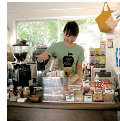
写真4 自由が丘の人気ベーカリーカフェ「Bake shop」が期間限定で営業していた「Baby Birds Bakery」。