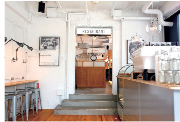
写真3 渋谷・美竹公園付近にある人気のカフェ「ON THE CORNER」に併設されているコーヒースタンド「No.8 BEAR POND」は下北沢に本店がある。

また、今年リニューアルオープンした、カフェとブックストア、ギャラリー、シェアオフィスが併設する「GOOD NEIGHBORS」は、「鹿児島から発信する新しいカルチャーとライフスタイル」をテーマに、音楽、デザイン、アート、映画、文学、食などジャンルを超えた創作活動を自然の中で楽しむ、体験型の野外イベント「GOOD